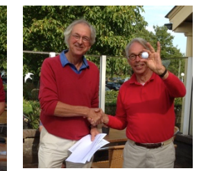
Jan ook een birdie

Einde van een mooie dag waarvan we iets moois hebben kunnen maken.