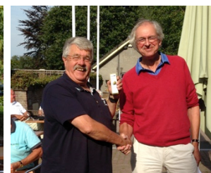
Dolf de derde prijs