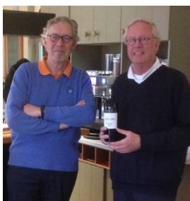
Jan de tweede prijs

A ball in your pocket is worth more than two in the bush!