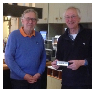
Job de derde prijs