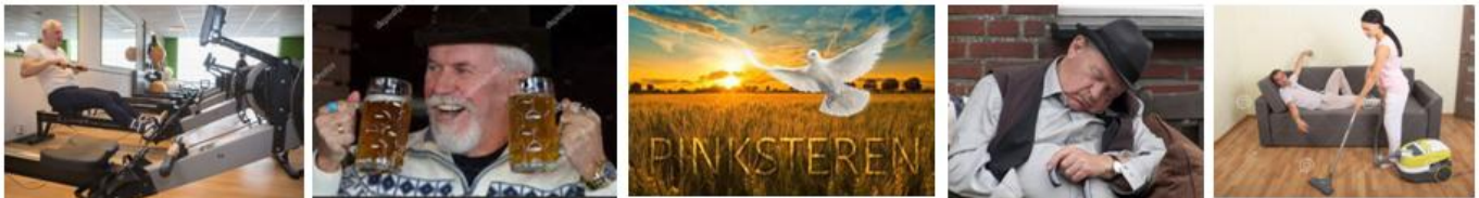
verschillende activiteiten tijdens Pinksteren om nieuwe energie op te doen

Opgetogen en vol enthousiasme kwamen de heren vanmorgen naar Anderstein om deel te nemen aan de 4 e Levade wedstrijd. Duidelijk was te merken dat zij de Pinksterdagen hebben gebruikt om eens goed uit te rusten en extra energie op te doen voor deze wedstrijd. Iedereen vult dat op zijn eigen manier in.