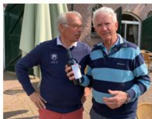
2 e prijs Karel van Elst