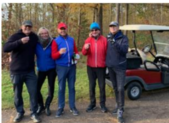
Jägermeister in de baan

Vandaag startten om 11:30 uur 60 Woensdagheren met de 14 holes shotgun Wildwedstrijd.