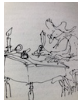
Uw scribent aan het werk !

Bij de 9-ners werd de winnaar Rinus van Bommel met 22 punten. Hij scoorde ook een birdie. Helaas kon er geen foto van Rinus gemaakt worden omdat hij al vertrokken was.