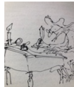
Uw scribentiaanhet werk