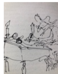
Uw scribent aan het werk